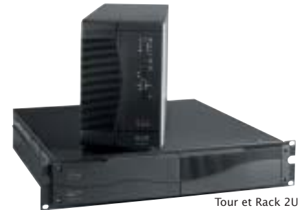
Tour et Rack 2U (700/1000/1500C)