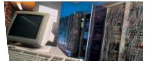
Intégration dans les racks à forte densité.