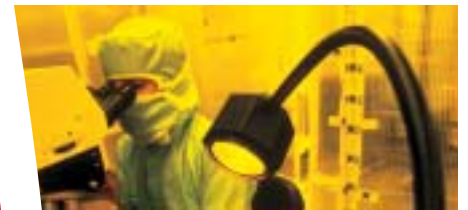
Idéal pour les infrastructures exigeant une grande continuité de service.