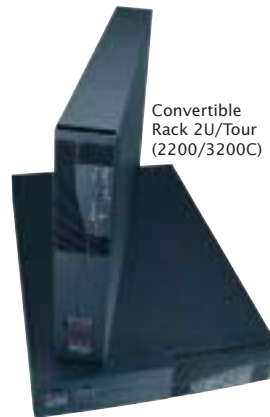
Convertible Rack 2U/Tour (2200/3200C)